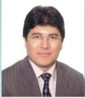
Yalçın Pekok Vakıf Gayrimenkul Değerleme A. Ş.